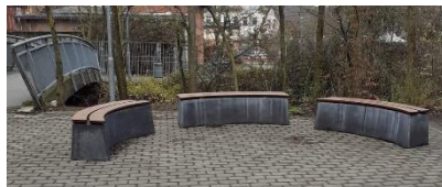
Neue Bänke für den Pausenhof