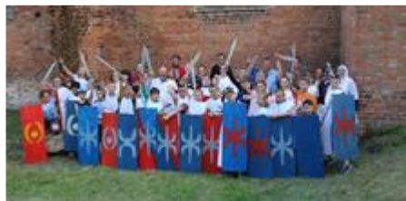
Ein Klassenprojekt „Römerzeit“ in einer 5. Klasse