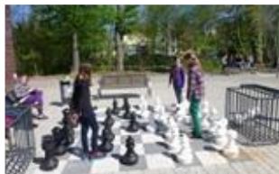
Ein Schachspiel für den Pausenhof