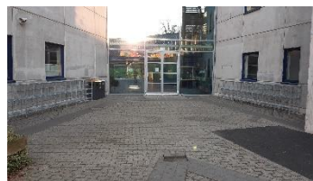
Neue Schultaschen-Regale drinnen und draußen