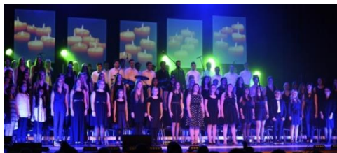
Das Weihnachtskonzert des Schulchores